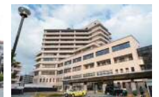
徳島市民病院まで1.3km