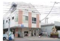
なかよし保育園まで500m