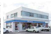
ローソン中吉野店まで460m